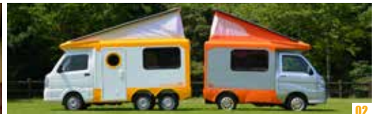
02. 4輪と6輪の全長を比較。6輪は660mm延長され、かなりのロングボディになったのが分かる。03. 純正シートは背面固定式なので、運転席・助手席ともリクライニングできるオリジナルシートを装着。04. 対面ソファの横(エントランスドア内側)は広いスペースを確保。かなりの量の荷物を積むことができる。